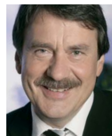
Wolfgang Jüttner, Vorsitzender der SPD- Fraktion im Niedersächsischen Landtag

Niedersachsen ist von den Auswirkungen der Atomenergie von allen Bundesländern am stärksten betroffen. Neben den drei im Lande befindlichen Atomkraftwerken befinden sich nahe der Landesgrenze in Schleswig-Holstein noch die