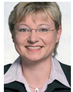
Frauke Heiligenstadt, schulpolitische Sprecherin der SPD-Fraktion im Niedersächsischen Landtag