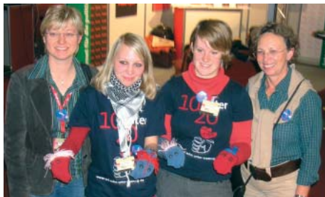
Mit Teilnehmerinnen des Projektes »10 unter 20« auf dem Bundesparteitag der SPD.

stalten, ist mir ein wichtiges Anliegen. Politik wird nicht im stillen Kämmerlein gemacht, sondern da, wo die Menschen sind.