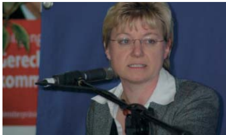
Beim Wahlkampfauftakt in Einbeck.

Mit 20 Jahren wurde ich in den Ortsrat Gillersheim gewählt und 1991 in den Gemeinderat Katlenburg-Lindau, wo ich auch heute noch aktiv bin. Die Möglichkeit, durch politische Diskussion und Gespräche mit den Menschen das Lebensumfeld in einer Gemeinde zu verbessern, macht mir auch heute noch viel Spaß. Mit anderen Menschen, alt und jung, gemeinsam unsere Gesellschaft zu ge-